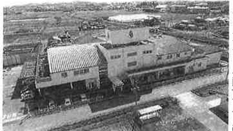
イヅミ食品埼玉工場 入りの決めた手になった。

イヅミ食品ホールディングスは、イヅミ食品埼玉工場(埼玉県原庄市)を本格稼働した。埼玉工場ではアルゴール抽出と熱水抽出による水産キヌ製品などの製造を3月から行っている。新場の設立により、従来から稼働しているボート食品(鹿児島県枕崎市)と合わせて、二拠点の生産体制が整い、生産量は倍増した。また、同社は新工場の設立を契機に、だし製品のラインアップを拡充し、チルド事業の展開もあつて、E.M.事業の積極化に乗り出す。 イヅミ食品埼玉工場 入りの決めた手になった。工場を新設した理由として、アルゴール抽出と熱水抽出による水産キヌ製品などの製造を3月から行っている。2021年1月、製造拠点をあつたボート食品の工場が手一杯になった。また、これまでも鹿児島県から出荷していたが、最大の生産拠点である鹿児島県の工場に、順次増員して、ボート食品の生産を供給するための、物流拠点を提供するために、埼玉工場を新設した。東日本ユーザーには埼玉工場、西日本にはボート食品の工場を供給する。新工場は、製造拠点を統合し、品質を統一し、水質がよく、廃水処理システムがすぐれている。東日本ユーザーには埼玉工場、西日本にはボート食品の工場を供給する。新工場は、製造拠点を統合し、品質を統一し、水質がよく、廃水処理システムがすぐれている。東日本ユーザーには埼玉工場、西日本にはボート食品の工場を供給する。